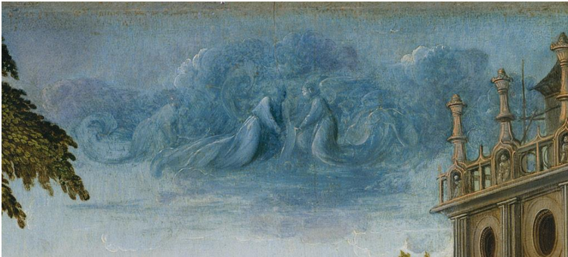
Virgin and Child with Angels - Bernard van Orley