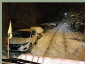
HA ESIK A HÓ...