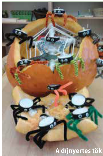
A díjnyertes tök

Sokat gondolkodtam, mit is faraghatna a Barackfa csoport ebben az évben. Próbáltam gyerekek fejjel gondolkodni, vajon mi tetszene nekem és más gyerekeknek is... aztán beugrott minden gyerekeret a szereti az izgó-mozgó bogarakat! Ezt tovább gondolva jött az ötlet legyenek mécses pókok, mert minél több mécses ég, a tök annál látványosabb. Így született meg a pókfészek, ami önmagáért beszélt!